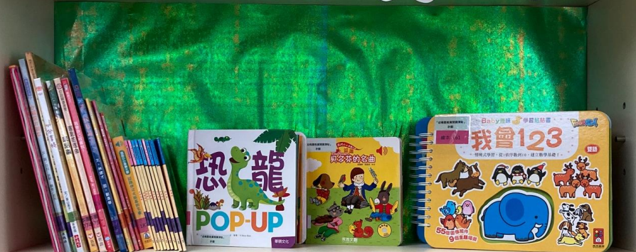
Parent and Child Reading Resource